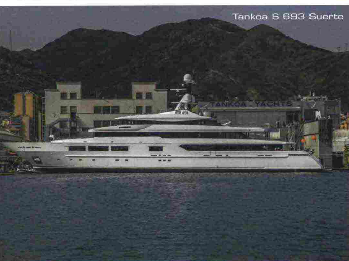
Tankoa S 693 Suerte