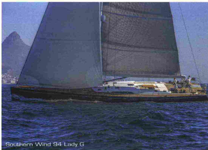
Southern Wind 94 Lady G