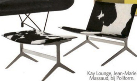
Kay Lounge, Jean-Marie Massaud, bij Poliform.