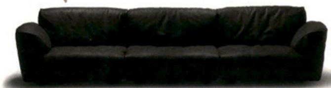
Grande Soflice, Francesco Binfaré, bij Edra.