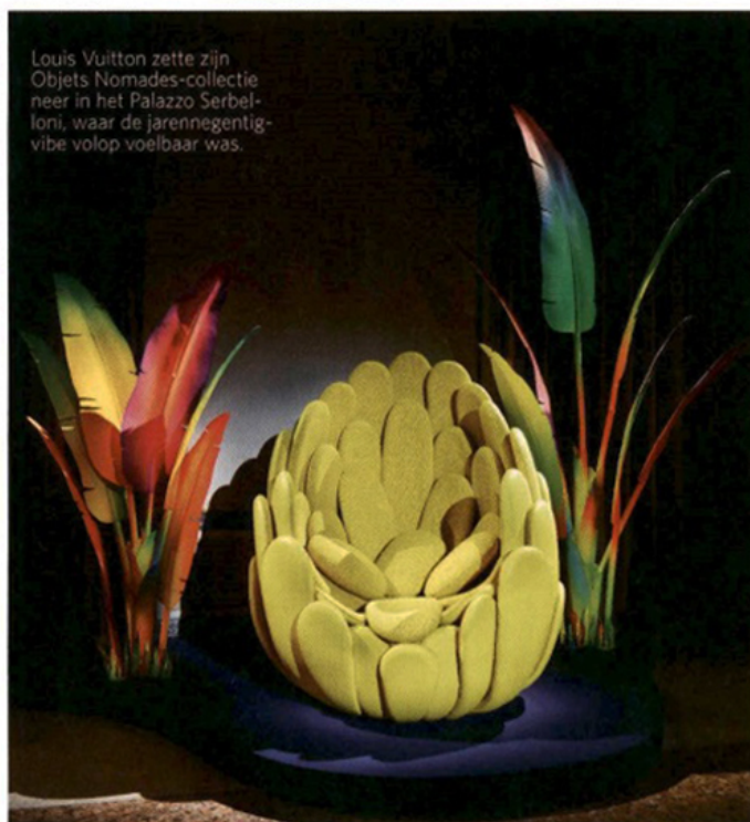
Louis Vuitton zette zijn Objets Nomades-collectie neer in het Palazzo Serbelloni, waar de jarennegentig-vibe volop voelbaar was.

Blikvangers dit jaar waren een glazen tafel, ontworpen door het Milanese Atelier Biagetti, en in leder geweven panelen van het Italiaanse duo Zanellato/Bortotto. Als was het opvallendste aan de installatie in het Palazzo Serbelloni de jarennegentig-vibe die in de eerste ruimtes werd neergezet. Een fluogeel exemplaar van de nieuwe Bulbo-loungestoel van de Campana-broers werd