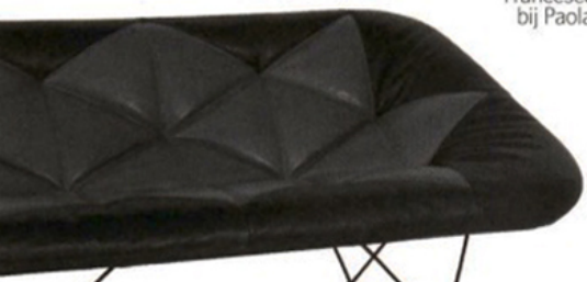
DS-319, Chen Min & de Sede Design Team, bij de Sede.