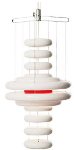
Leuchte „UFO“ führt 1975 das Space Design der 60er-Jahre fort (Verner Panton Design)