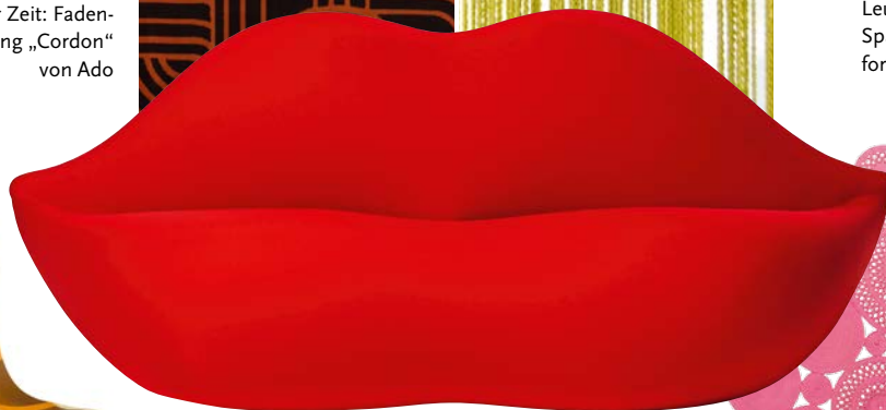
Seit 1971 produziert Gufram das Sofa „Bocca“ aus kalt geschäumtem Polyurethan mit waschbarem, elastischen Bezugsstoff