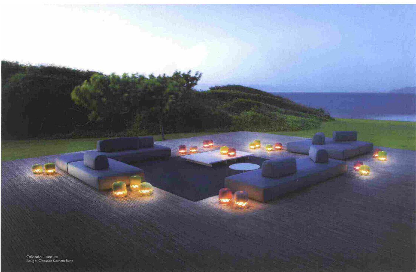
Orlando - sedute design: Claesson Koivisto Rune