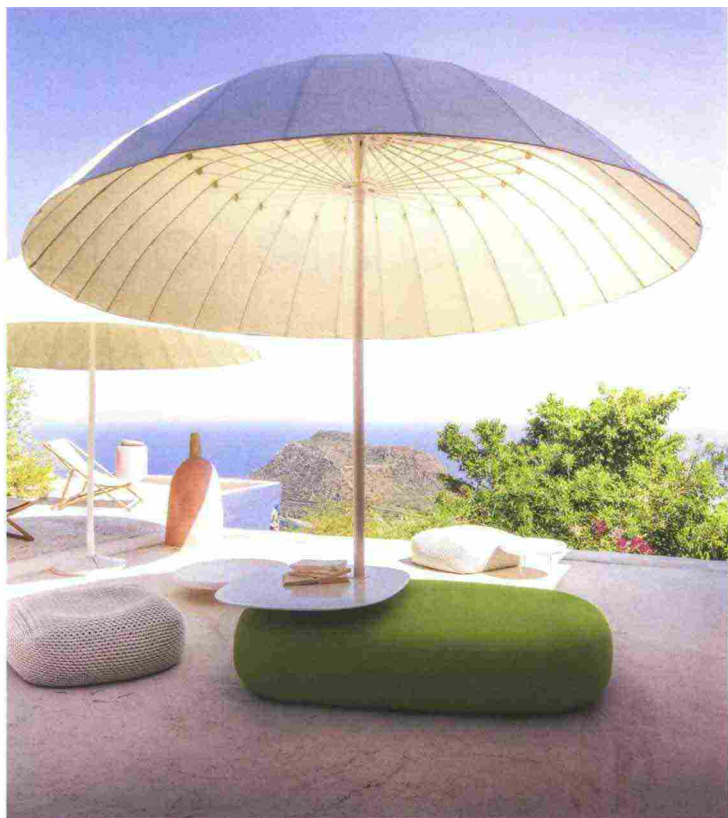
Bistrò – ombrelloni design: CRS Paola Lenti

Anche quest'anno abbiamo l'opportunità di essere presenti in zona Brera. I nostri prodotti, e in particolare la nuova collezione di sedute e tavoli da esterno di cui abbiamo già accennato prima, arredano il dehors della boutique La Tenda. L'installazione prevede anche strutture ombreggianti rivestite con tessuti di collezione in tonalità di colore inedite che andranno dal verde chiaro al