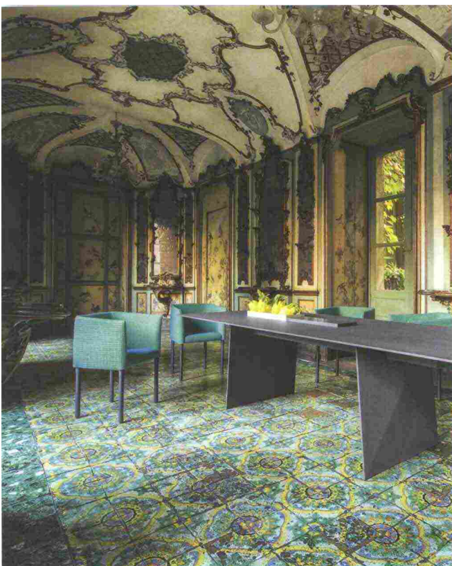
Elsie – sedie design: F. Rota

siero di creare un divano, un salotto, un insieme, ma vogliamo vedere i nostri pezzi all'interno di architetture che siano confacenti e coerenti ai nostri ideali. Da questo concept nasce ad esempio Build, il sistema di pannelli modulari che generano vere e proprie strutture architettoniche. Oggi indoor e outdoor dialogano fra loro attraverso i colori, i materiali e le finiture, con prodotti che non si prestano a convenzioni e che non impongono caratteristiche definite, ma che permettono mille contaminazioni.