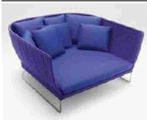
NOME PRODOTTO AMI