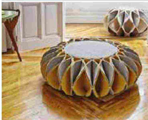
NOME PRODOTTO RUFF POUF