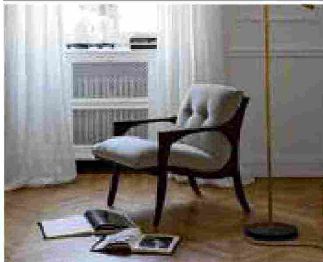
NOME PRODOTTO ARMCHAIR BRIDGE

Poltrona dalle forme sinuose e definite, il cui particolare profilo ricurvo della struttura di appoggio rievoca dettagli di design del passato in una chiave interpretativa moderna, adattabile a qualsiasi ambiente.