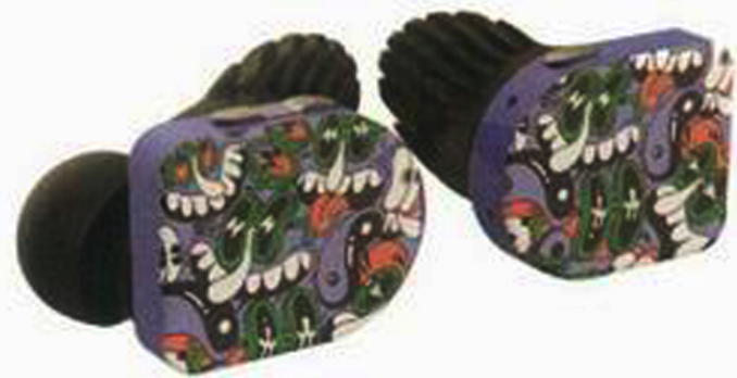
Master &amp; Dynamic