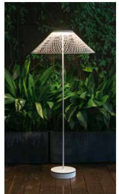
Spanska Metalartes ledlampa Pamela är elegant både inne och ute. Den finns i olika finish – mässing, svart krom och vitmålad. Pamela försöker inte vara något annat en lampa. Designer är Ramón Úbeda och Otto Canalda.