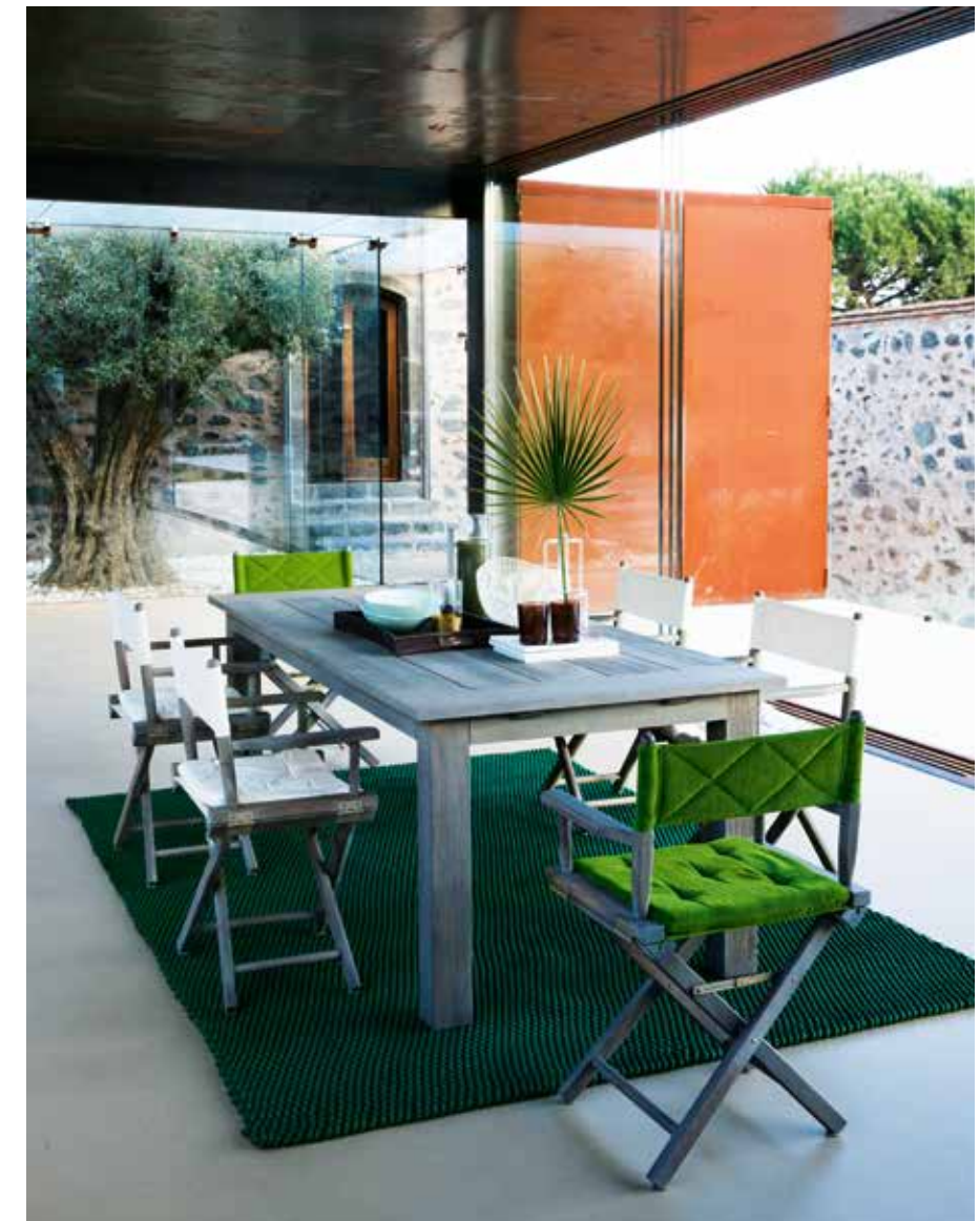
Unopiuss regissörstol Ginger är en tidlös ikon. I orange, grön, röd eller gul bomullscanvas är den utemöbel och i den nya begränsade upplagan i läder mer lämplig inomhus. Stommen är i teak. Här ses Ginger med vadderad rygg och sits. Mattan är i den nya serien Baku i den hygieniska syntetfibern olefin.