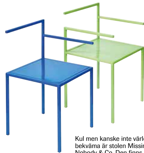
Kul men kanske inte världens mest bekväma är stolen Missing från italienska Nobody & Co. Den finns i åtta varianter och i en rad pastellfärger i puderlackat stål.