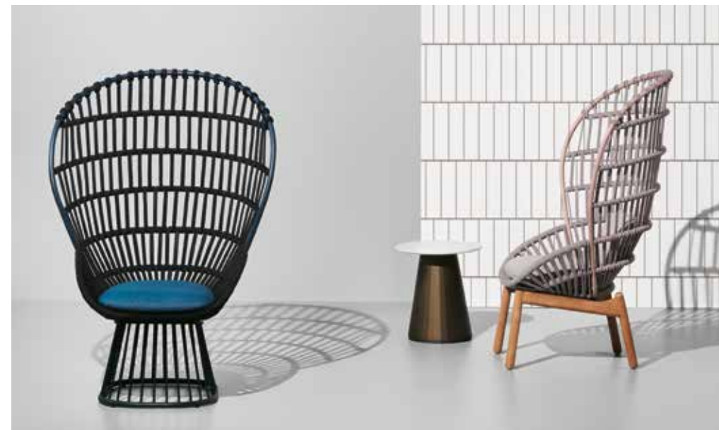
Stor rumslig närvaro har Kettals stol Cala med sin transparenta rygg. Design Doshi Levien, det vill säga Nipa Doshi och Jonathan Levien. Höga Cala har metallöverdragna rep och bas och den lägre en bas i teak. Allt lämpligt för utomhus. Kuddtextilierna, också Doshi Levien, finns i många färger och i geometriska mönster.

→ Metalarte har skapat Pamela för ändamålet. Design Úbeda och Canalda. Det är rätt och slätt en graciös golvlampa med en skärm i form av ett spetsverk.