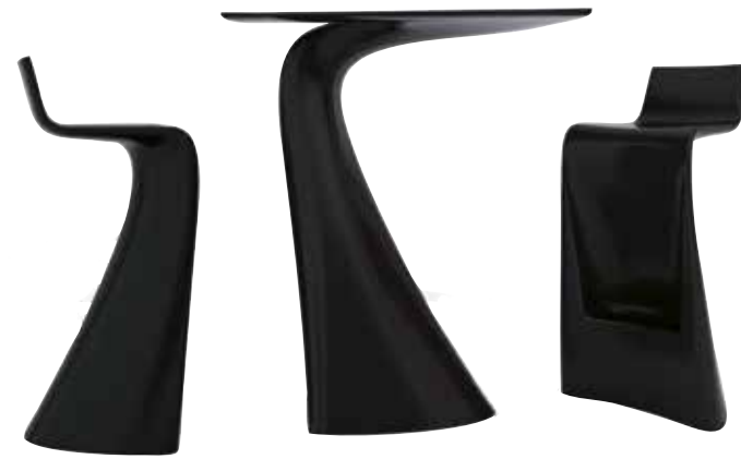
Vondoms skulpturala Wing är designad av A-cero. Svängda och kurviga linjer har vävts ihop på ett dynamiskt sätt. Här är det barbord och barstol med stark visuell effekt. Möblerna är gjorda i polyetylen och helt återvinningsbara. Finns också i vitt och grått.