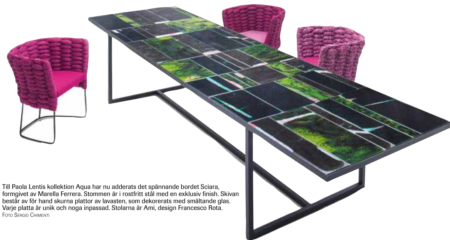
Till Paola Lentis kollektion Aqua har nu adderats det spännande bordet Sciarra, formgivet av Marella Ferrera. Stommen är i rostfritt stål med en exklusiv finish. Skivan består av för hand skurna plattor av lavasten, som dekorerats med smältande glas. Varje platta är unik och noga inpassad. Stolarna är Ami, design Francesco Rota.