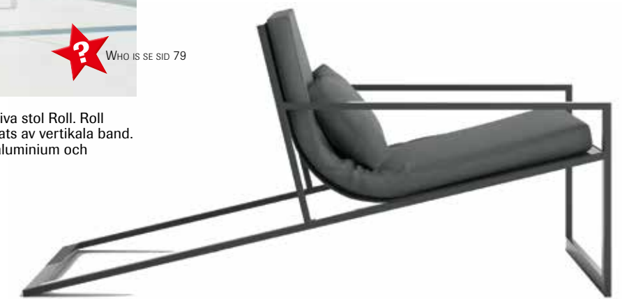
Gandia Blascos nya kollektion Blau har tagits fram i samarbete med Fran Silvestre Arquitectos. Blau loungestol har raffinerade, minimalistiska former. Stomme i puderlackat aluminium och i dynorna polyuretanskum och en väderbeständig textil. Finns i beige, vit och antracit.