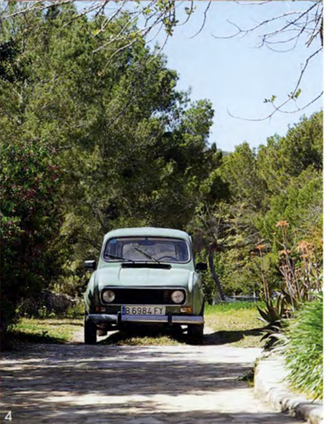
1. Sieste ombragée. Les chambres, le salon à l'étage et l'atelier, où Roze qui pratique la technique japonaise du raku a installé son tour de potier, ouvrent sur des terrasses partiellement couvertes. 2. Confort rustique au salon où les maquettes de bateaux de Majorque flottent dans l'espace. Des troncs de conifères massifs servent traditionnellement de poutres. Tapis marocains. Les tables basses aux formes de pétales ont été réalisées sur place, à partir de feuilles de métal soudées. Vases et pots créés par Roze. 3. Touche ethnique dans le salon du rez-de-chaussée : canapé Paola Lenti, tapis marocain et table basse fabriquée au Sénégal. 4. Dans le jardin, la 4L tout-terrain !