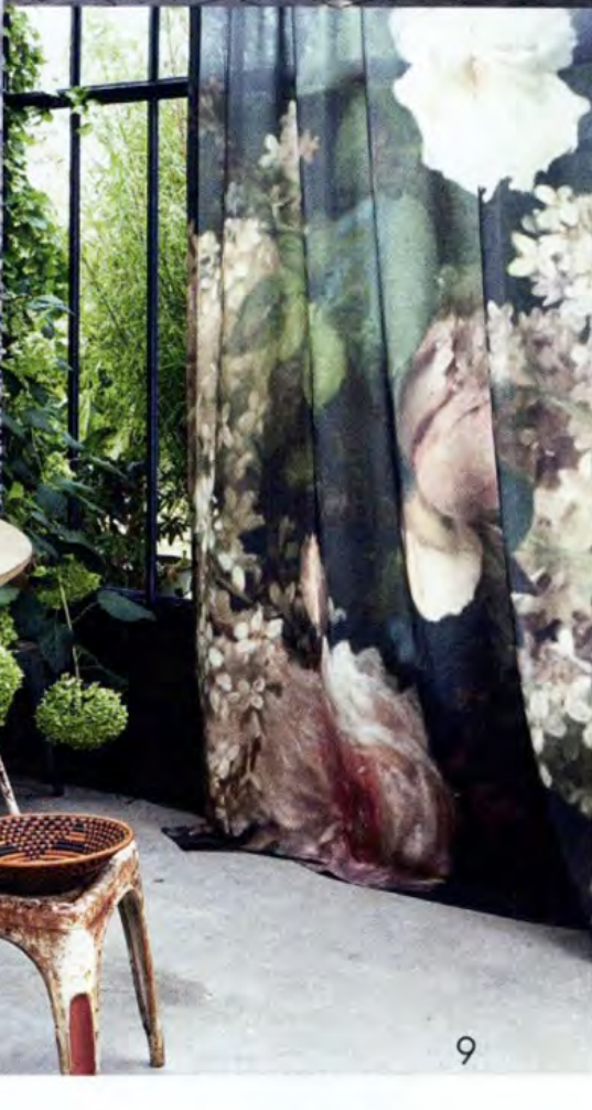
1. Chaises "Ami", design F. Rota, Paola Lenti . 2. Chaises "Bertoia Asymmetric", Harry Bertoia, Knoll . 3. Banc coll. Somerset et coussins coll. Envie d'Ailleurs, Fermob . 4. Chaises "Piazza", design Jun Yasumoto, Colos . 5. Panier, coll. Marni Playland, Marni . 6. Vase "Forms", House Doctor . 7. Fauteuil et repose-pieds, coll. Bay, design Henrik Pedersen, Gloster . 8. Table basse "Bornholm", design BoConcept design team, BoConcept . 9. Tissu "Artémis", Élitis .