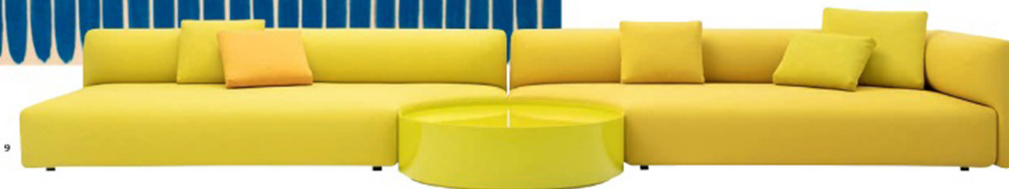
1. Столшизы и табурет, Gervasoni 2. Лампа Ficuspala, Cassina R&D 3. Ваза, Bitossi 4. Комод Offshore, Porro 5. Кресло Back-Wing, дизайн Патрисии Урзиулы, Cassina 6. Стул Gala, Moroso 7. Ковер Slope, Kvadrat 8. Стол Tavola 130, Dimore Studio 9. Диван Walt, Paola Lenti