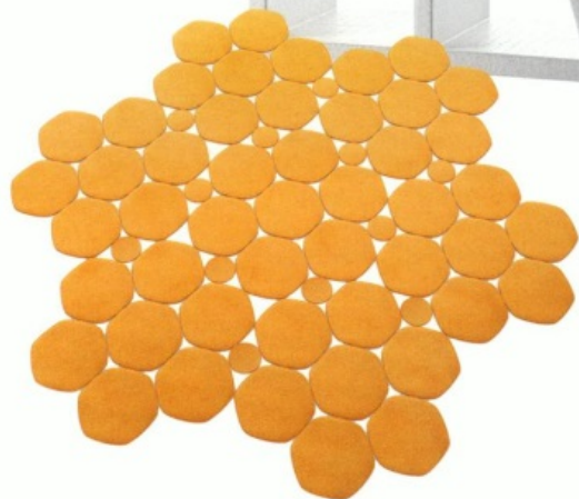
ПЧЕЛАМ ПОНРАВИТСЯ Наращаемый стеллаж Orus Incertum из стопроцентно рециклируемого пластика. Casamania Фетровый ковер Prisma выпускается в разных цветах и конфигурациях. Paola Lenti