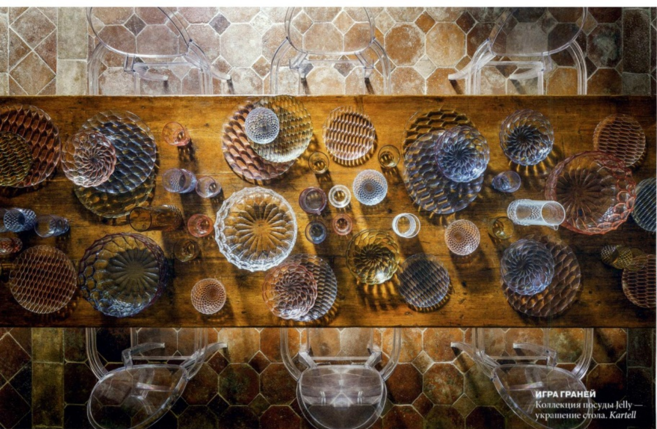
ИГРА ГРАНЕЙ Коллекция посуды Jelly — украшение стола. Kartell