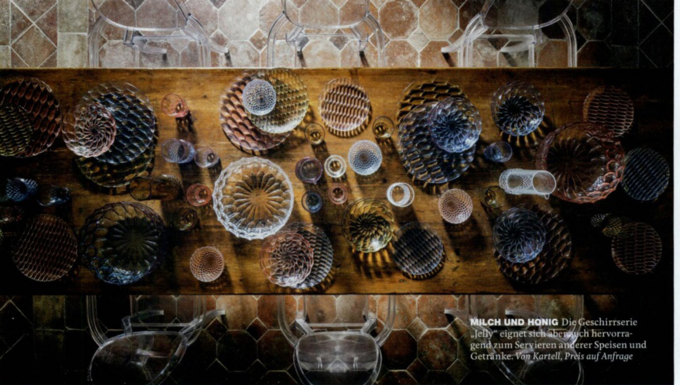
MILCH UND HONIG Die Geschirrserie „Jelly“ eignet sich aber auch hervorragend zum Servieren anderer Speisen und Getränke. Von Kartell, Preis auf Anfrage