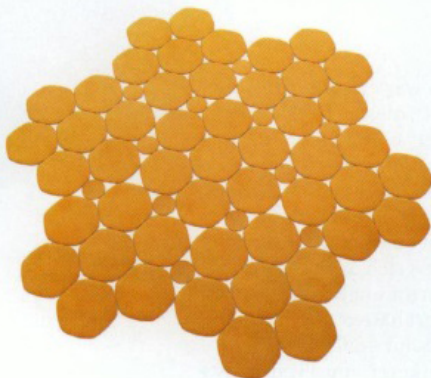
BIENENFREUNDLICH Stapelbares Regal „Opus Incertum“ aus 100%ig recyclingfähigem Kunststoff. Von Casamania, ab € 363 (Mitte). Filz-Teppich „Prisma“, erhältlich in verschiedenen Farben und Ausführungen. Von Paola Lenti, (unten)

Michelle Obama, die ein Jahr zuvor die Aufstellung zweier Bienenstöcke im Garten des Weißen Hauses veranlasst hatte. Prompt zog New Yorks Natural History Museum und die Radio City Music Hall nach, auf deren Dächern ebenfalls erste Bienenstöcke angesiedelt wurden. Nektar aus dem berühmten Central Park ist schließlich eine Ansage. Wenig später war auch der bernsteinfarbene Honig von den exotischen Pflanzen des Bronx Botanical Garden Kult. Ähnliches lässt sich seit einigen Jahren in vielen weiteren Städten beobachten: Pariser Miel béton, der urbane „Betonhonig“, den Rémy Vanbremeersch aus seinen Bienenstöcken im 10., 12., 19. und 20. Arrondissement gewinnt, fängt die Vielfalt der Jahreszeiten ein. Im Frühling schmeckt er nach den Blüten der Akazien und Kastanienbäume, im Sommer nach Linde, im Herbst nach japanischem Schnurbaum.