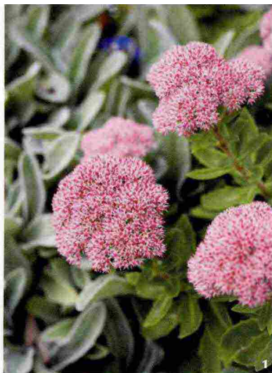
1. Sedum telephium 'Herbstfreude'.