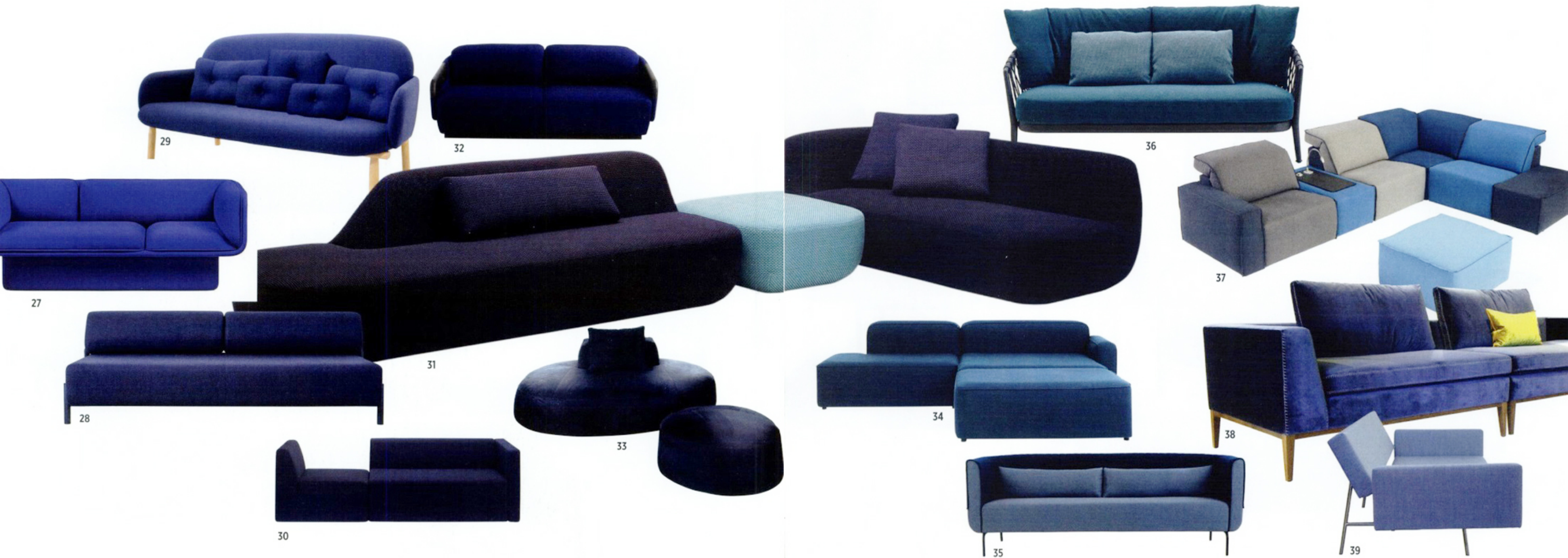
27 Sur socle 'Block', design Mut Design, L. 200 cm, àpd 2 794 €, Missana. 28 Minimaliste 'Paolo', L. 190 cm, 1 299 €, Hem. 29 Rondouillet 'Georges', design Guillaume Delvigne, L. 146 cm, 1 890 €, Hartò. 30 Tranché 'Kerman', design Philipp Mainzer & Farah Ebrahimi, L. 223 cm, 5 620 €, E15. 31 Ludique 'Uptown', design Francesco Rota, élément de gauche, L. 220 cm, élément central, L. 97 cm, élément de droite, L. 188 cm, 9 172 €, Paola Lenti. 32 Dodu 'Worn', design Samuel Wilkinson, L. 167 cm, àpd 3 219 €, Casamania. 33 Galets 'Milos', design Marc Sadler, L. 207 cm, 2 729 €, pouf, 749 €, Désirée Divani.

Combiné à de belles lignes et matières, le bleu démontre qu'il peut être une couleur chaude.