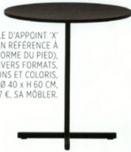
TABLE D'APPOINT 'X' (EN RÉFÉRENCE À LA FORME DU PIED), DIVERS FORMATS, FINITIONS ET COLORIS, APD Ø 40 x H 60 CM, 777 €, SA MÖBLER.

'GREENHOUSE', MINISERRE POUR L'INTÉRIEUR, DESIGN ATELIER 2+, 95 x 40 x 135 CM, 890 €, DESIGN HOUSE STOCKHOLM.