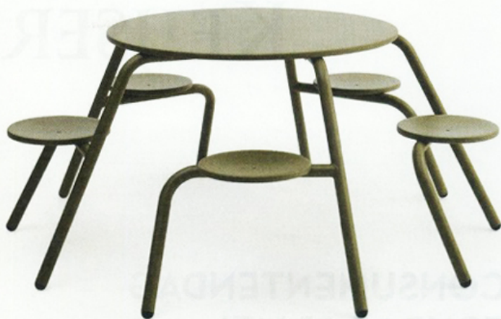
Picknicktafel Virus , Dirk Wynants voor Extremis