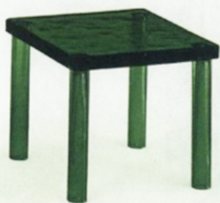
Bijzettafel Nesting , Glas Italia