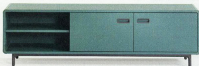
Lage kast Extenz , Artifort