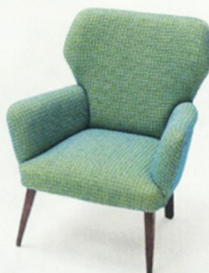
Stoel van Paola Lenti