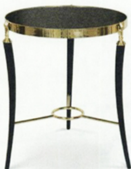
Bijzettafel Gisele , Koket