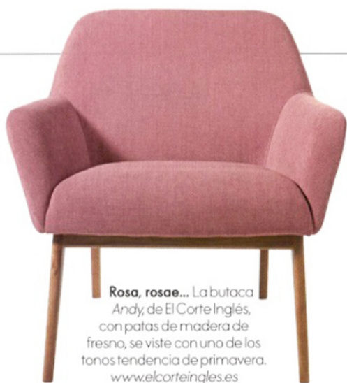
Rosa, rosae... La butaca Andy, de El Corte Inglés, con patas de madera de fresno, se viste con uno de los tonos tendencia de primavera. www.elcorteingles.es