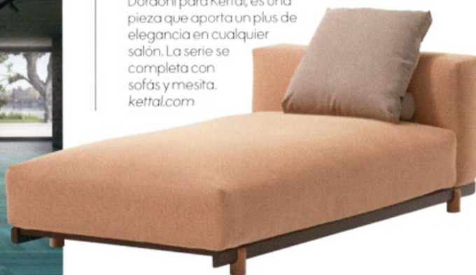
Momento de relax. De líneas sencillas y bellas, la chaise longue Molo, de Rodolfo Dordoni para Kettal, es una pieza que aporta un plus de elegancia en cualquier salón. La serie se completa con sofás y mesita. kettal.com