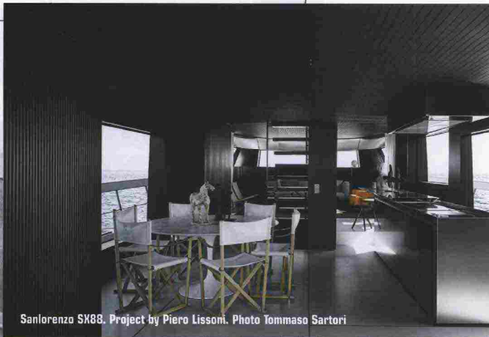
Sanlorenzo SX88. Project by Piero Lissoni.