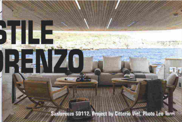
Sanlorenzo SD112. Project by Citterio Viel.

L'artista Emilio Isgrò afferma con convinzione che: "Il vero lusso è la cultura" e a bordo degli yacht