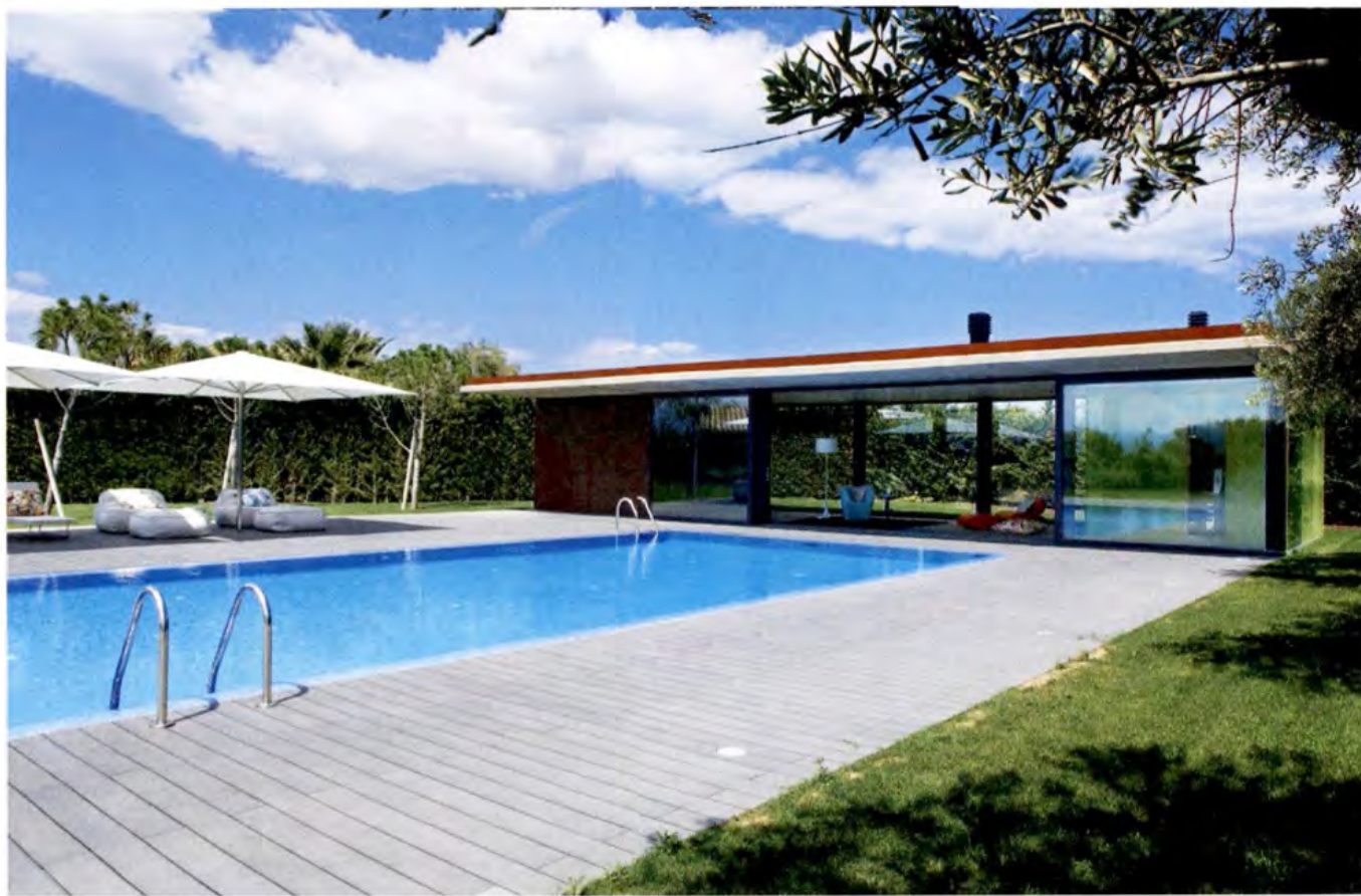
TEXTOS: ADA MARQUÉS.