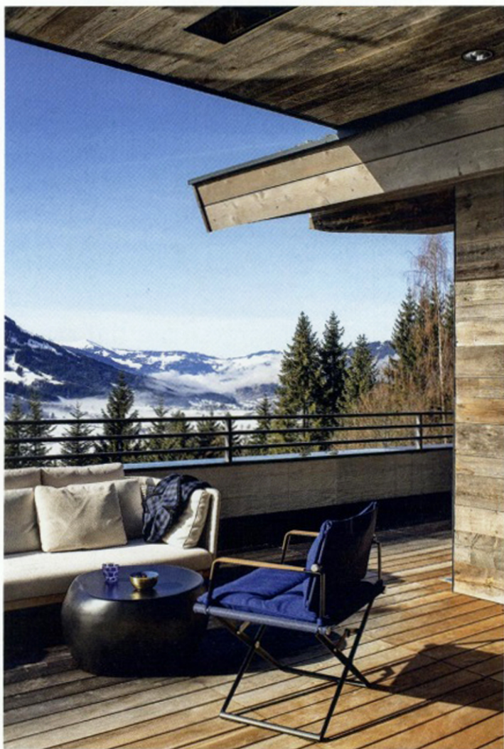
Die traumhafte Terrasse nimmt die komplette Giebelseite ein. (Sofa «Sab» von Paola Lenti, Sessel «Sea X» von Dedon, Couchtisch von Laboratorio dell'imperfetto)