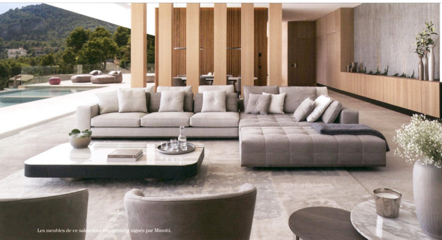
Les meubles de ce salon sont entièrement signés par Minotti.