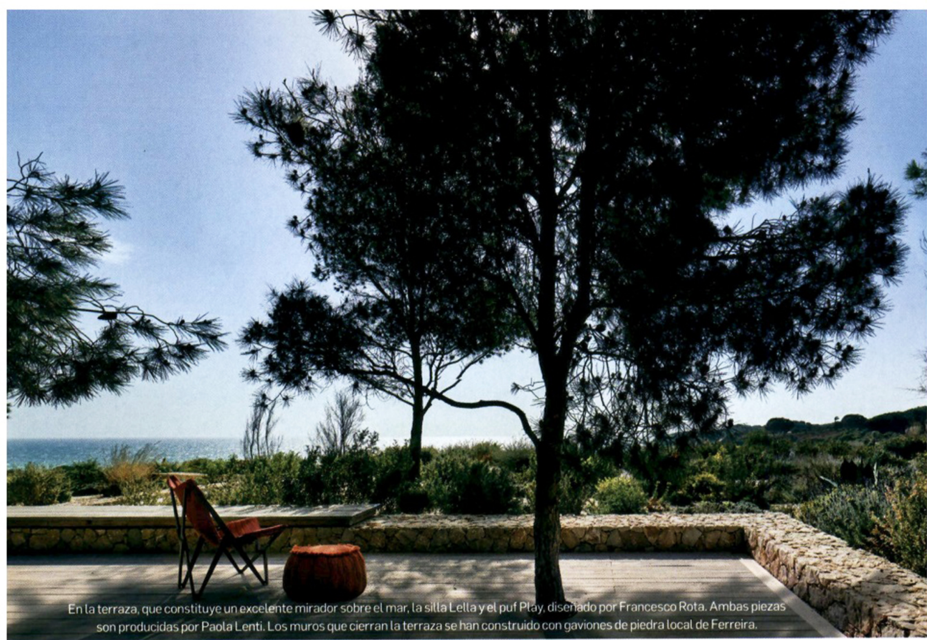
En la terraza, que constituye un excelente mirador sobre el mar, la silla Lella y el puf Play, diseñado por Francesco Rota. Ambas piezas son producidas por Paola Lenti. Los muros que cierran la terraza se han construido con gaviones de piedra local de Ferreira.

interiores y los comunican con diversos espacios exteriores. El jardín con vegetación autóctona contribuye a incorporar la casa a la Naturaleza de la costa. La vivienda está compuesta por una sola planta, con cuatro muros de piedra que cierran el terreno en los lados este y oeste. El juego de cubiertas inclinadas que corona los muros dota a los interiores de gran riqueza espacial. La distribución de las estancias gana en proporcionalidad. En la cocina, nace una isla de ocho metros que se extiende a lo largo del comedor y la sala de estar, uniendo estos espacios de intenso intercambio familiar y social. Una gran mesa de roble centraliza las actividades culinarias.