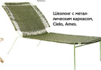
Шезлонг с металлическим каркасом, Cielo, Ames.