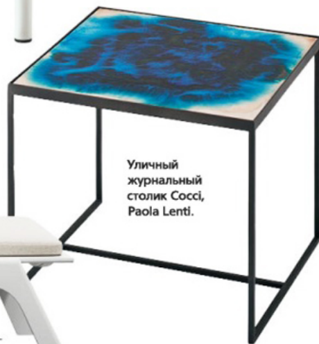
Уличный журнальный столик Cocci, Paola Lenti.