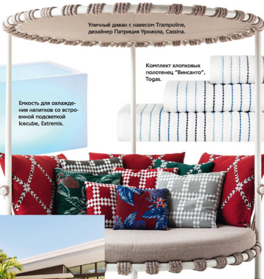
Уличный диван с навесом Trampoline, дизайнер Патриция Уркиола, Cassina.