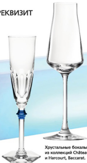
Хрустальные бокалы из коллекций Château и Harcourt, Baccarat.