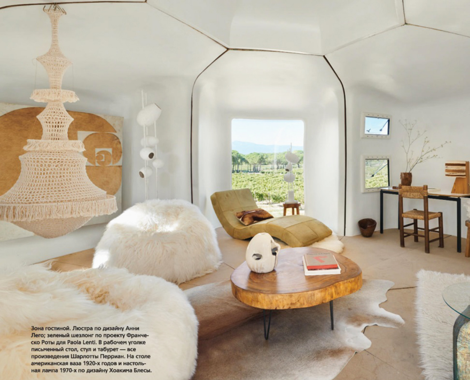
Зона гостиной. Люстра по дизайну Анни Лего; зеленый шезлонг по проекту Франческо Роты для Paola Lenti. В рабочем уголке письменный стол, стул и табурет — все произведения Шарлотты Перриан. На столе американская ваза 1920-х годов и настольная лампа 1970-х по дизайну Хоакима Блеса.

> По задумке Мансваля, модуль делился на пять зон: кухню, гостиную, две спальни и ванную. Предполагалось, что этого достаточно для семьи из трех-четырех человек. Дома также можно было соединять между собой, увеличивая таким образом площадь. Однако Каstellла решил отказаться от традиционной планировки и сделал все пространство общим, вообще избавившись от кухни и туалета. Они есть в доме друзей, на участке которых Серж установил свою “ракушку”, и ему этого достаточно. Здесь он только отдыхает и наслаждается пейзажами.