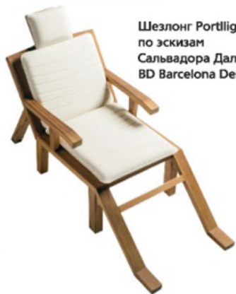
Шезлонг Portlligat по эскизам Сальвадора Дали, BD Barcelona Design.