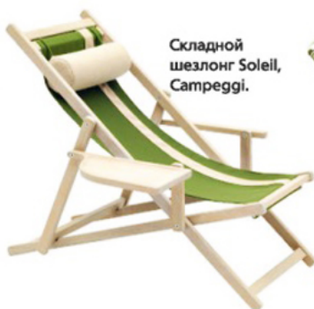
Складной шезлонг Soleil, Campeggi.