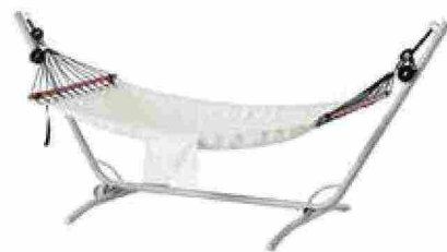
● Amaca Fredön appesa al supporto Gårö . www.ikea.com