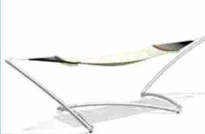
● Air lounge , amaca con rete Ultra Dry Core Comfort Mesh. www.tuuci.com