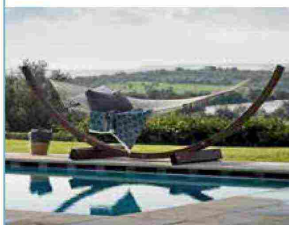
● Amanda , amaca con rete in polipropilene. www.unopiu.it