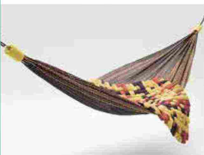
● Farniente , amaca in tessuto tecnico multicolor. www.paolalenti.it