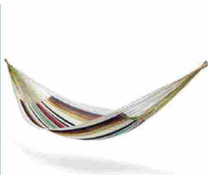
● Luna , amaca in tessuto a due posti in nylon. www.missonihome.com