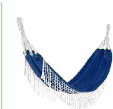
● Amaca in cotone con frange. www.coincasa.it