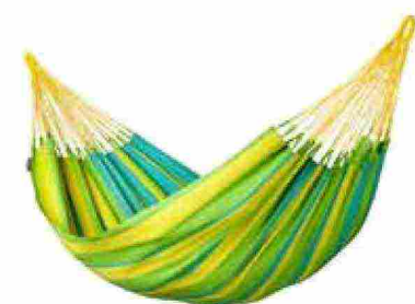
● Sonrisa , amaca classica fatta a mano in Colombia. www.lasiesta.com