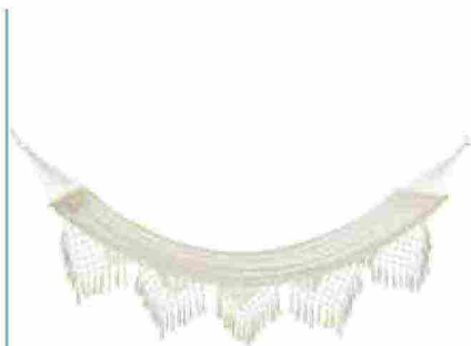
● Happy Zen , amaca da esterno intrecciata écru. www.maisonsdumonde.com

COLORATE, RUSTICHE O TECNICHE, LE AMACHE RIMANDANO A PARADISI TROPICALI. UN CONSIGLIO PER LA COMODITÀ: SDRAIATEVI IN DIAGONALE