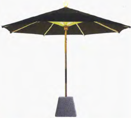
● NI Parasol 300 con illuminazione. www.foxcatdesign.com

SCOMMETTERE SU UNA PROTEZIONE SOLARE MOBILE SIGNIFICA PORTARE IL FRESCO DELL'OMBRA SEMPRE CON SÉ. TANTE LE SOLUZIONI DISPONIBILI SUL MERCATO: FACILI DA PULIRE E DA RIPORRE AL COPERTO IN INVERNO