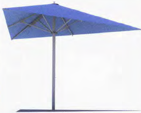
● Big Ben ombrellone triangolare. www.michaelcaravita.com