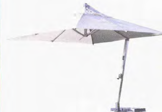
● Copacabana ombrellone quadrato. www.varaschin.it