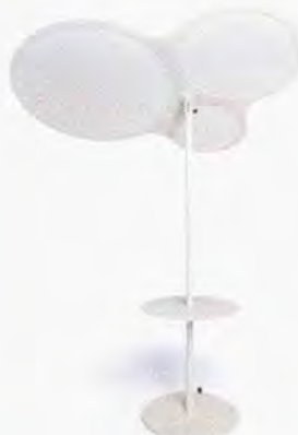
● Coral Reef parasole con piano d'appoggio. www.robertirattan.com