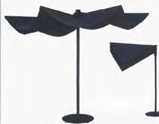
● Om parasole rotondo in tessuto tecnico. www.calma.cat