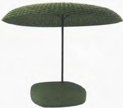
● Mogambo ombrellone con seduta. www.paolalenti.it