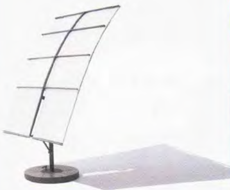
● Gea ombrellone orientabile in tessuto. www.giorgettimedia.com