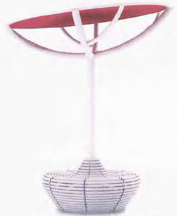
● Zeste parasole con seduta integrata e led. www.beauetbien.com