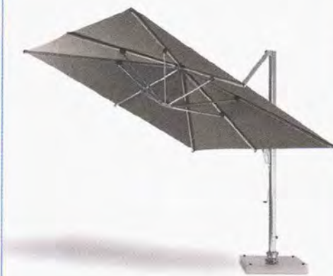
● Freedom ombrellone orientabile 3x3 m. www.ethimo.com