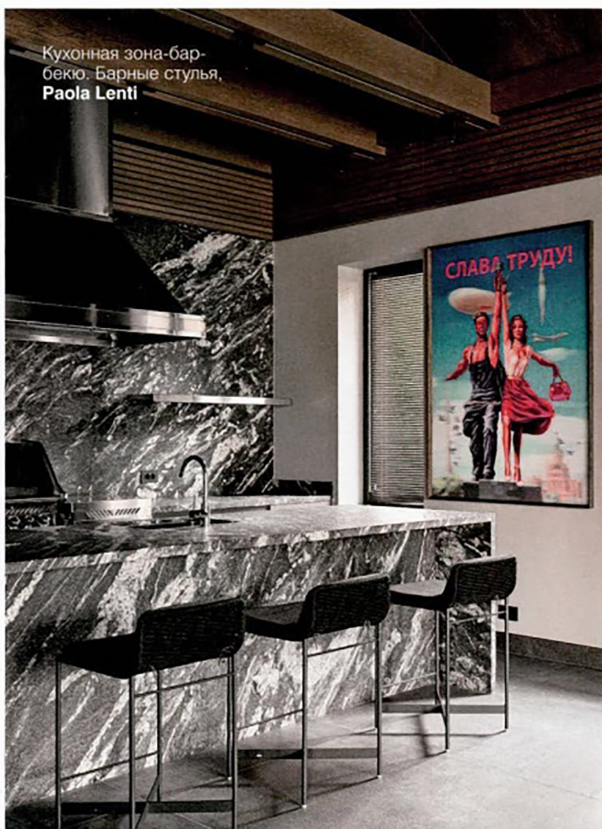
Кухонная зона-бар-бекю. Барные стулья, Paola Lenti