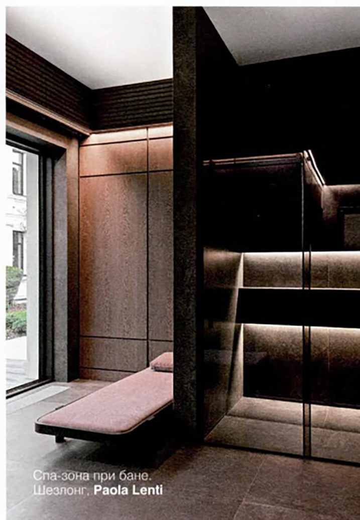
Спа-зона при бане. Шезлонг, Paola Lenti