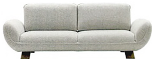
CALLIGARIS Favola, divano in tessuto ispirato al futon