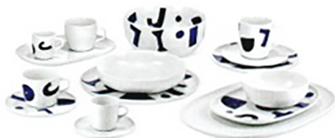
ALESSI Itsumo, piatti in porcellana by Naoto Fukasawa