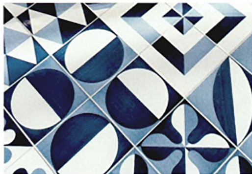
FRANCESCO DE MAIO Blu Ponti, piastrelle decorate a mano