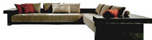
LAURAMERONI Plaza, divano in Mdf e vernice metallica