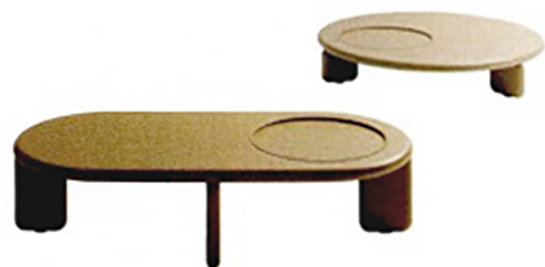
LEMA Orion, tavolini in Mdf con vassoio, in varie forme