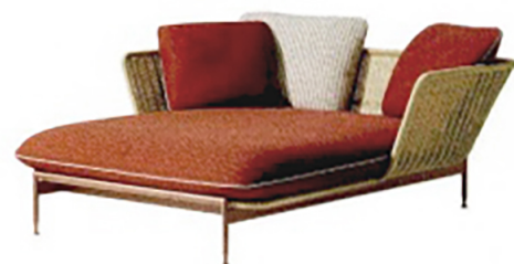
CASSINA Esosoft outdoor, daybed in fibra intrecciata