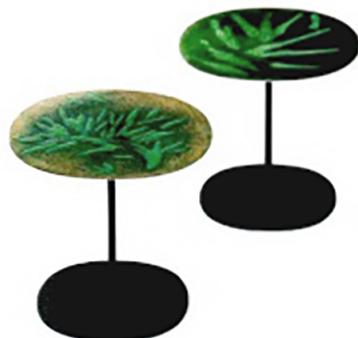
PAOLA LENTI Strap, tavolini in rame o alluminio smaltati