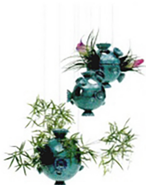
GIORGETTI Marimo, vasi ispirati all'alga giapponese