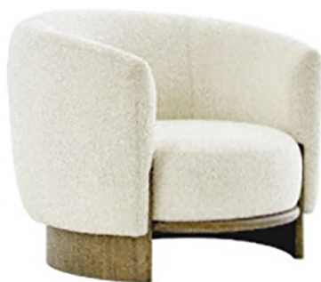
PARLA Hug, poltrona in legno e tessuto bouclé