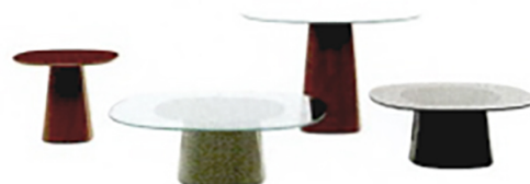
B&B ITALIA Allure o' dot, tavolini in due altezze