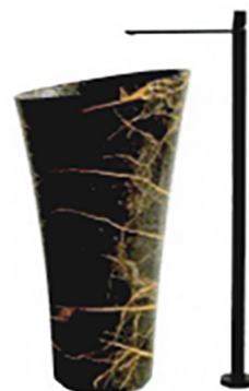
ANTONIOLUPI Tuba, lavabo free standing in marmo