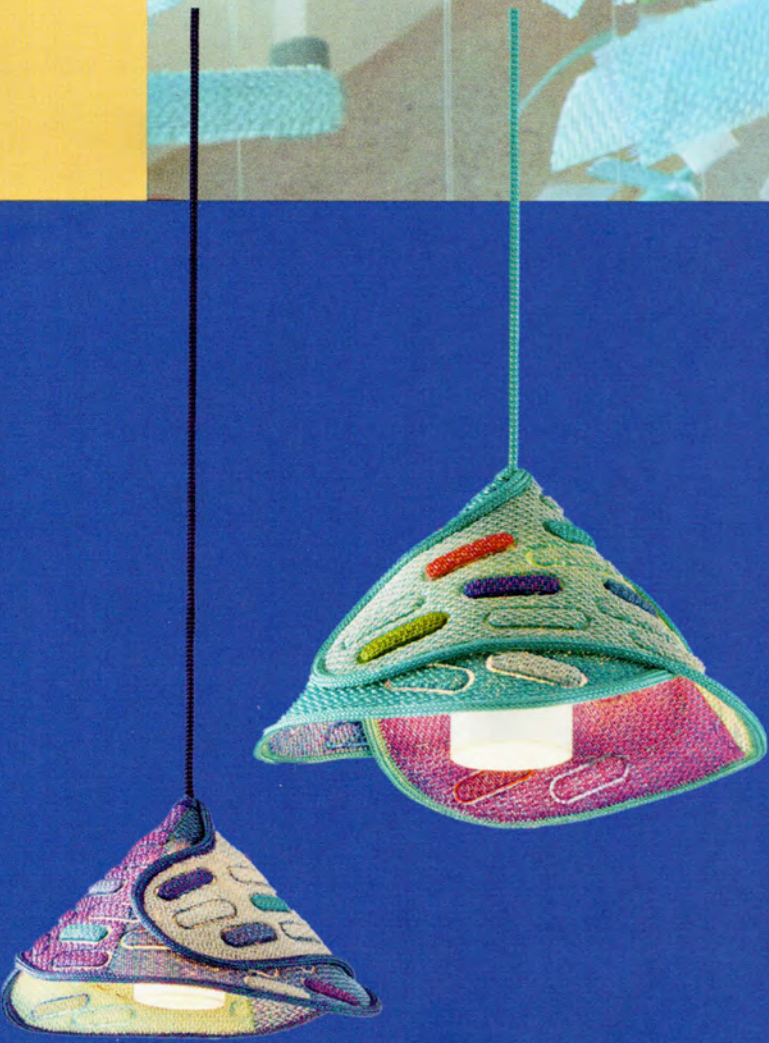
Lámparas Hana Arashi de Estudio Nendo para Paola Lenti | paolalenti.it