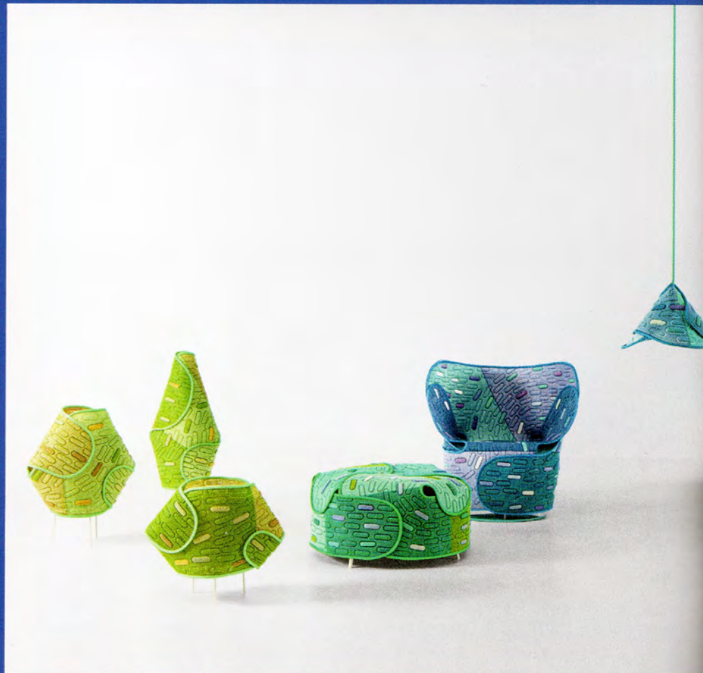
Hana Arashi de Estudio Nendo para Paola Lenti | paolalenti.it