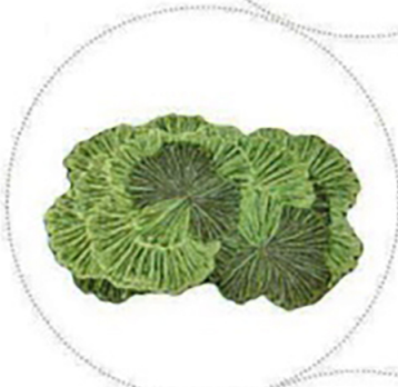
Teppich „Bo- tanica“ von Bodo Sperlein für Gan Rugs, P. a. A.