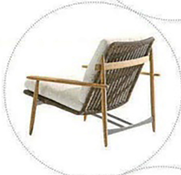
Outdoor- Sessel „Trio“ von Minotti, ab 4750 €