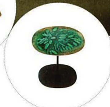
Outdoor-Tisch „Strap“ von Paola Lenti, P. a. A.

Äste, Bambus, Pilze oder Blätter – sie inspirieren mit ihren organisch-kunstvollen Formen jetzt die Designer. Genau so beliebt fürs Interior sind ihre Farben – von Grün bis Braun in allen erdenklichen Nuancen.