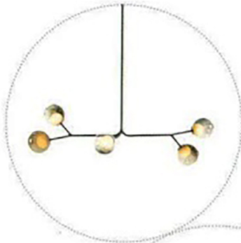
Pendelleuchte „28.5a.1“ von Bocci, P. a. A.