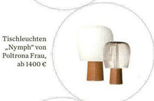
Tischleuchten „Nymph“ von Poltrona Frau, ab 1400 €