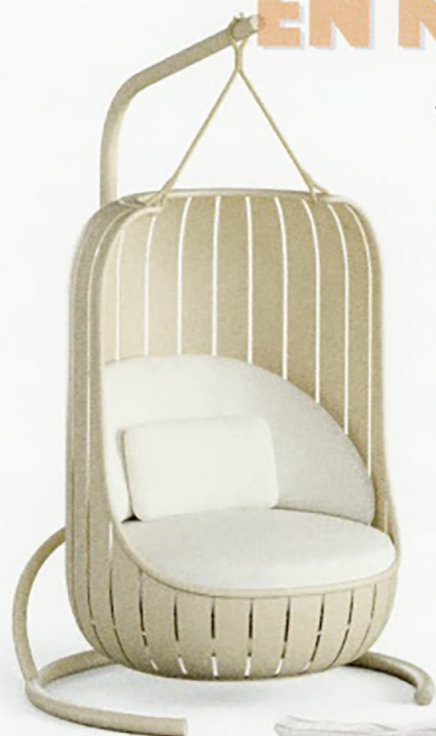
Hangstoel Swing uit de collectie Arena van Gandia Blasco.

Weerbestendig wil niet zeggen dat er ingeleverd moet worden op comfort en stijl.