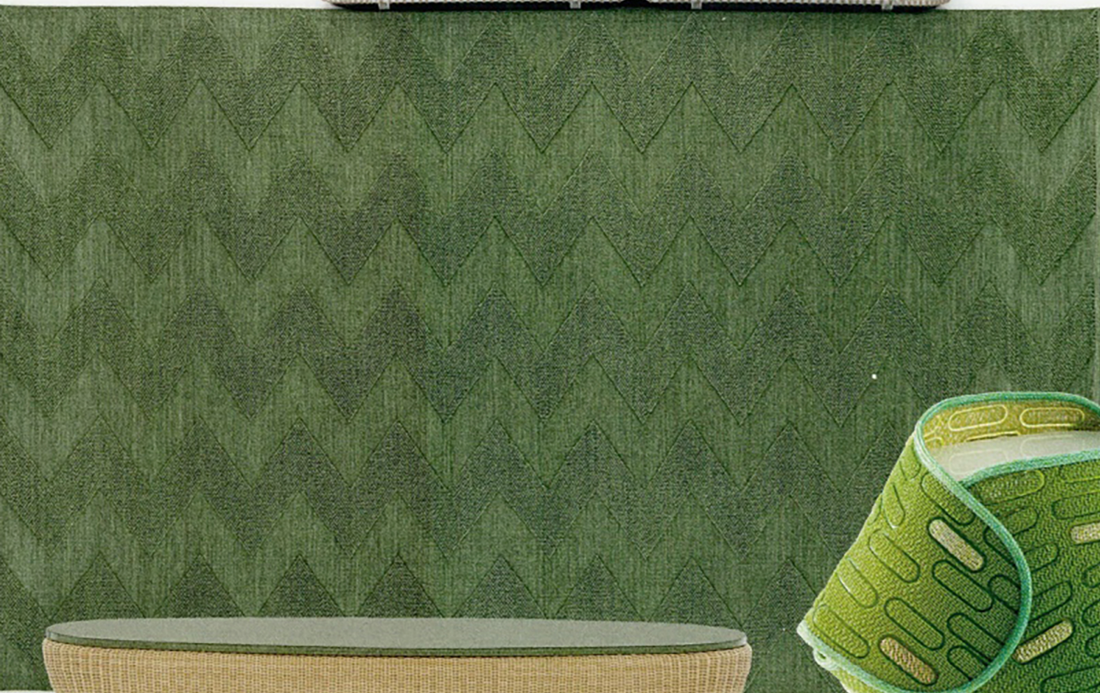
Outdoor-vloerkleed Tetide van Studiopepe voor Ethimo, met zigzagpatroon in kleur Alga Green.