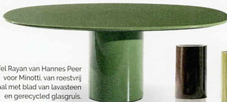
Tafel Rayan van Hannes Peer voor Minotti, van roestvrij staal met blad van lavasteen en gerecycled glasgruis.