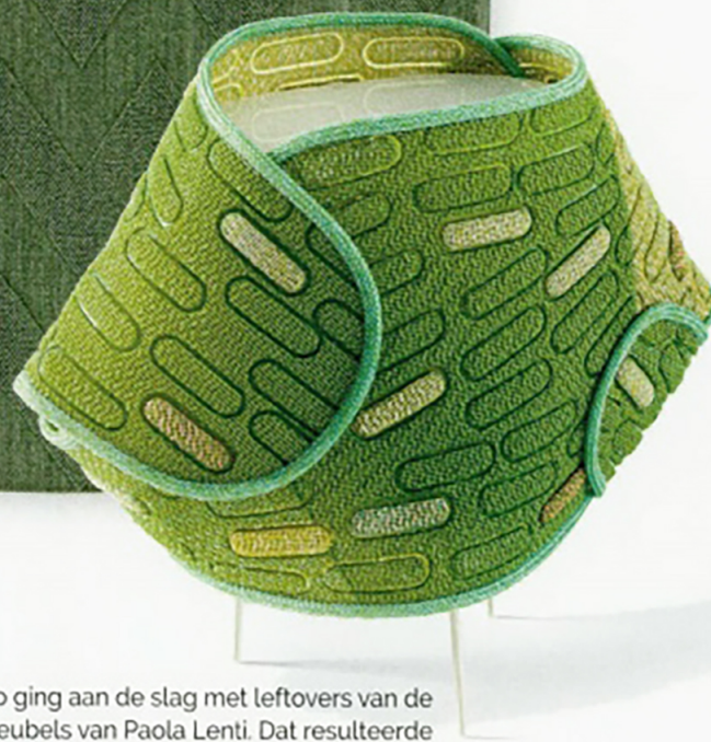
Nendo ging aan de slag met leftovers van de outdoormeubels van Paola Lenti. Dat resulteerde in vloerlamp Hana-arashi.