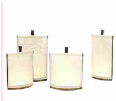
● Pillow , progettata per essere appesa al ramo di un albero. www.rodaonline.com