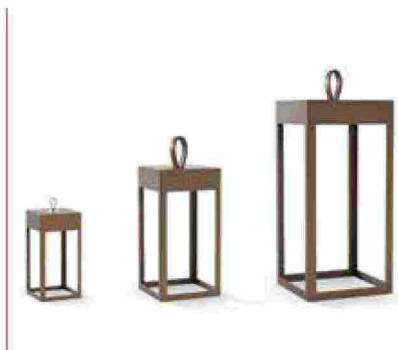
● Eteera , la sua forma si ispira alle vecchie lanterne. www.platek.eu

PERFETTE PER ILLUMINARE E DECORARE IL TERRAZZO O IL GIARDINO, QUESTE LUCI SONO FACILMENTE POSIZIONABILI E POSSONO ESSERE SPOSTATE DA UN AMBIENTE ALL'ALTRO