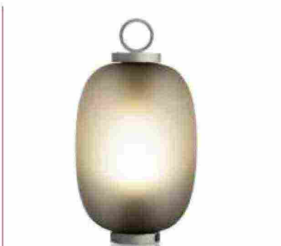
● Lucerna , lampada in metallo e vetro soffiato. www.ethimo.com