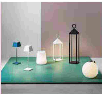
● In&Out , lampade senza filo ideali per illuminare l'outdoor. www.rossinigroup.it