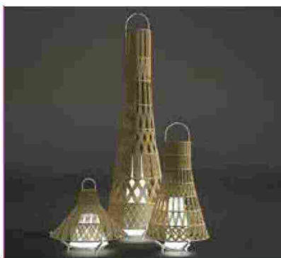
● Tribal , lanterna dalla forte ispirazione etnica. www.talentispa.com