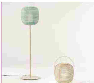
● Bela , lanterna in corda disponibile in diversi colori. www.kettal.com