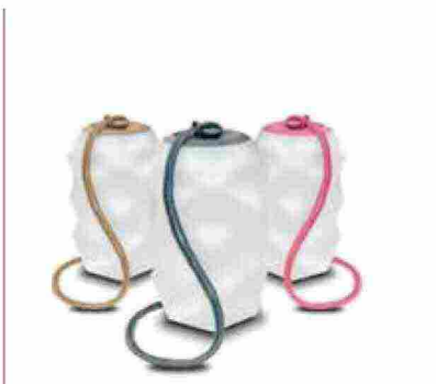
● Bitá , lampada leggera a sospensione wireless. https://newgarden.es