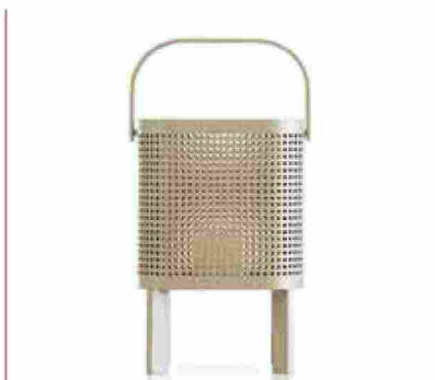
● Solanas , lanterna in metallo distribuita in diversi colori. www.gandiablasco.com