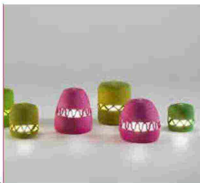
● Agadir , lanterna realizzata con corda in filato Rope. www.paolalenti.it