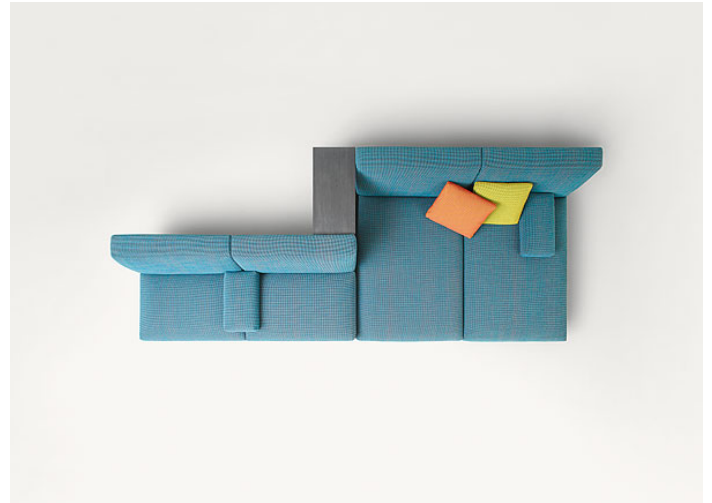
B93DB + B93Z + n°2 B93S