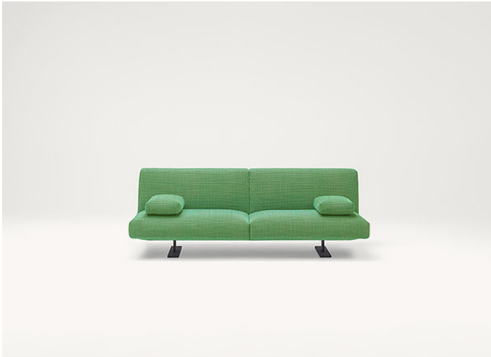
B93DB + n°2 B93S