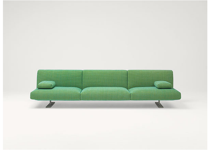
B93FB + n°2 B93S