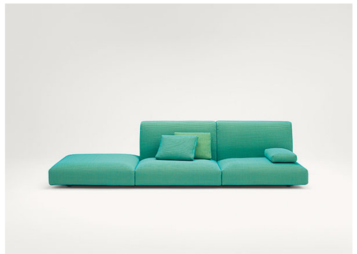
B93HA + B93S