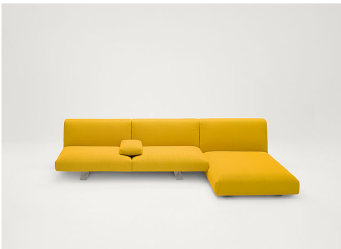
B93CB + B93S + B93V