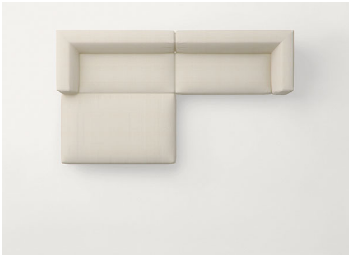
B93XSB + B93XDB + B93M