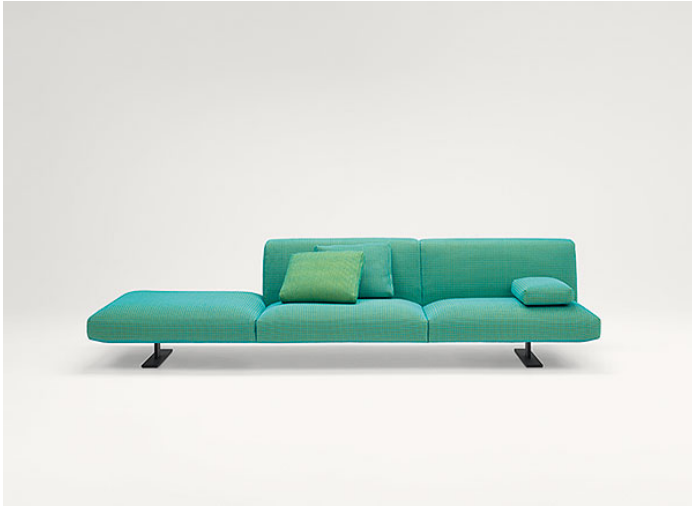
B93HB + B93S