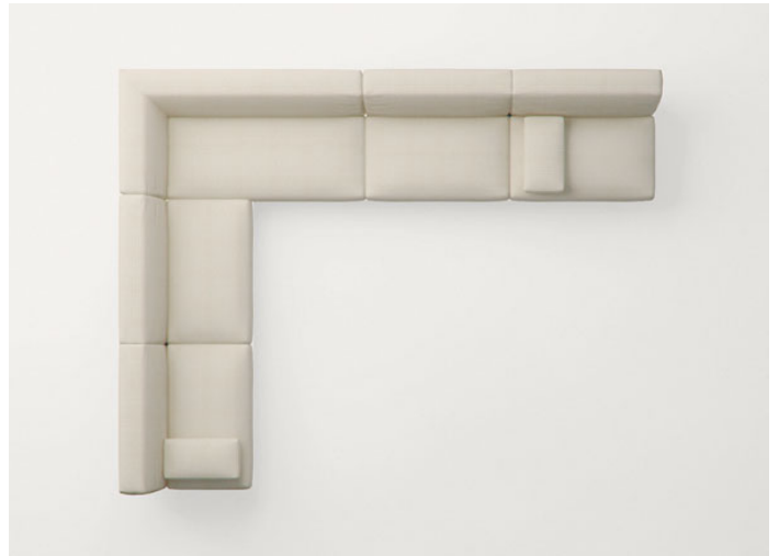
n°2 B93DB + B93XSB + n°2 B93S