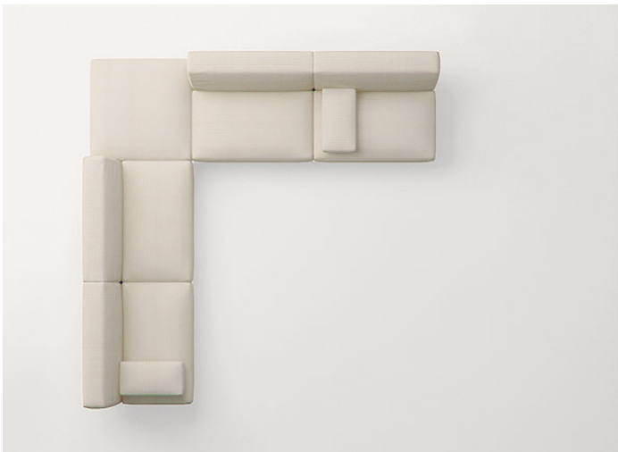
B93TB + B93DB + n°2 B93S