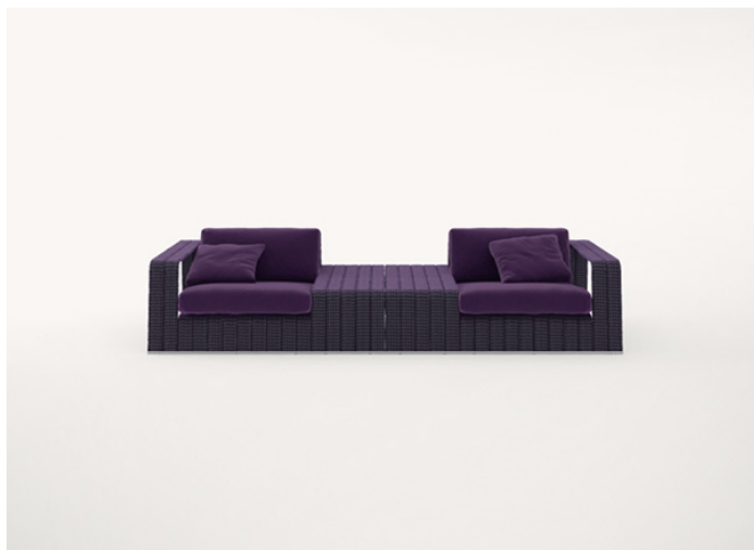
B18TS + B18TD