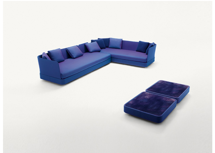
B25D + B25N + n° 2 B25SCS + n° 4 B25SCA + B25SCD + n° 2 B25H