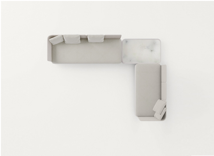
B25D + B25SCS + n° 3 B25SCA + B25L + B25N + n° 2 B25SCA + B25SCD