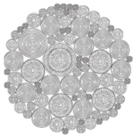
cm Ø 250 98"