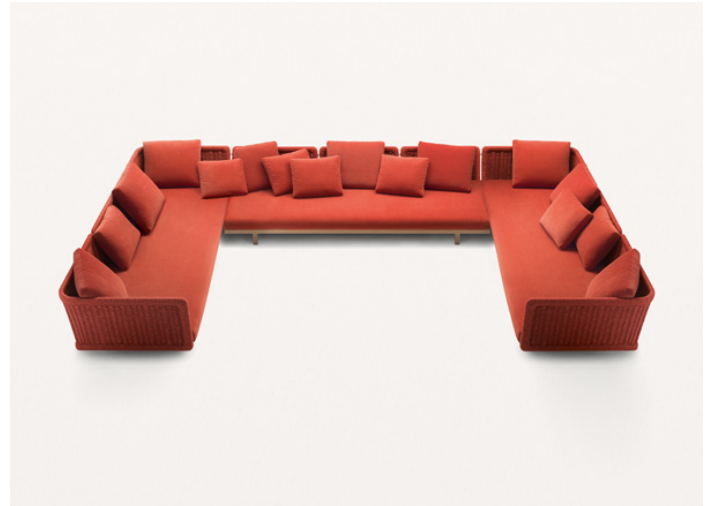
n° 2 B39B + B39F