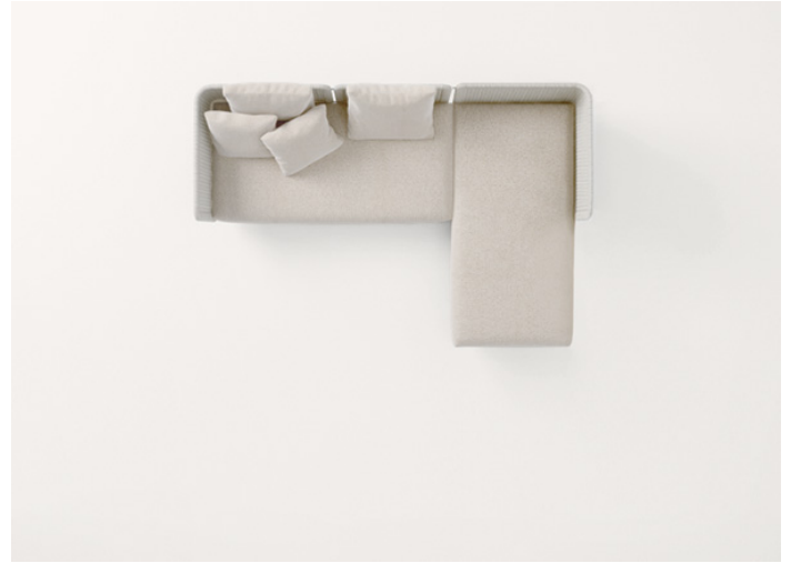
B39CS + B39NS