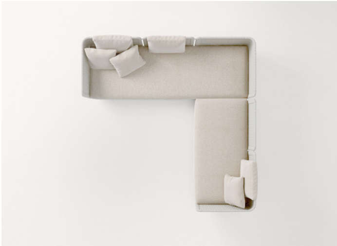
B39B + B39CD