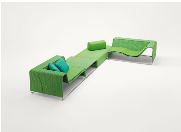
Island B11S + Island B11PA + Orlando B77B + Island B11CLD