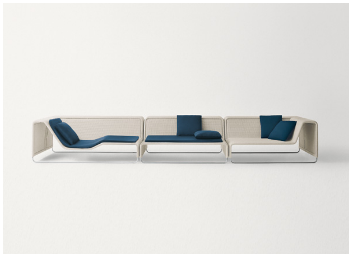
B11CLS + B11C + B11D