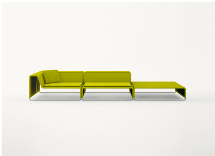
B11S + B11C + B11PB