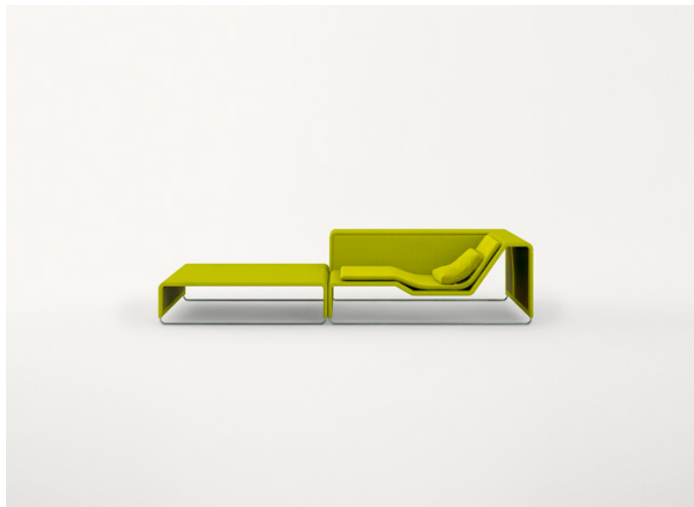
B11PB + B11CLD