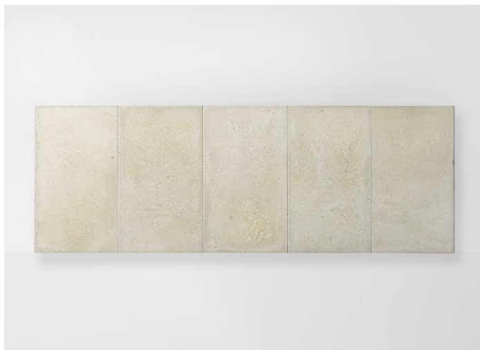
Concreto, Seres CON17BS