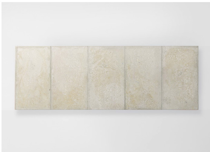
Concreto, Seres CON20BS