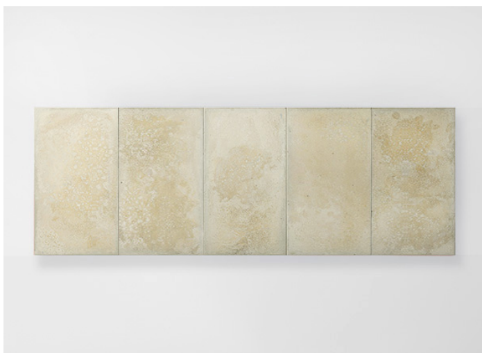
Concreto, Seres CON17S