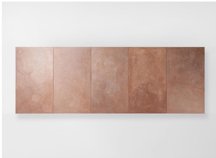
Concreto, Seres CON0A1S