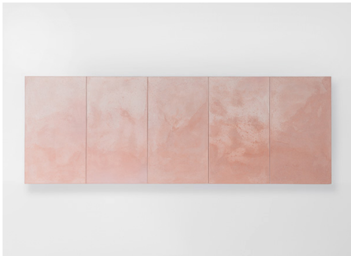
Concreto, Seres CON024S